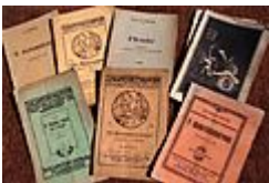
Livrets de pièces en alsacien