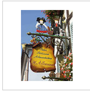
De nos jours, un symbole de tourisme