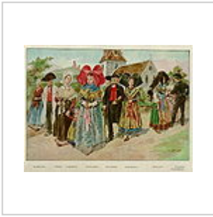
Divers costumes, en 1919