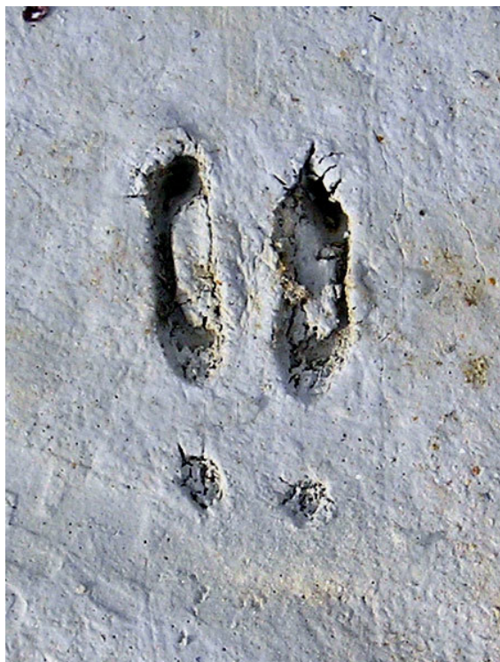
Empreinte du sabot dans le sable

ses déplacements dans la neige très difficiles, contrairement au chamois. Dans les pentes raides, à l'arrière de ses talons, des ergots font saillie et augmentent la surface d'adhérence au rocher.