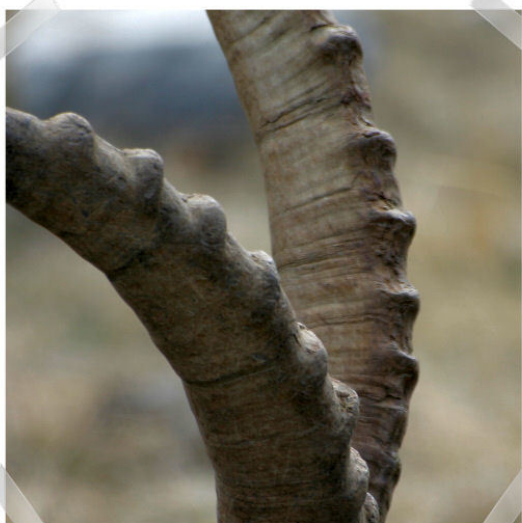
Gros plan sur les cornes d'un bouquetin mâle

Contrairement aux idées reçues, les nodosités des cornes des bouquetins mâles ne permettent pas de calculer leur âge. Ce sont en fait les stries de croissance de l'encornure formant une suite d'étuis emboîtés qu'il faut compter pour déterminer l'âge d'un mâle adulte.