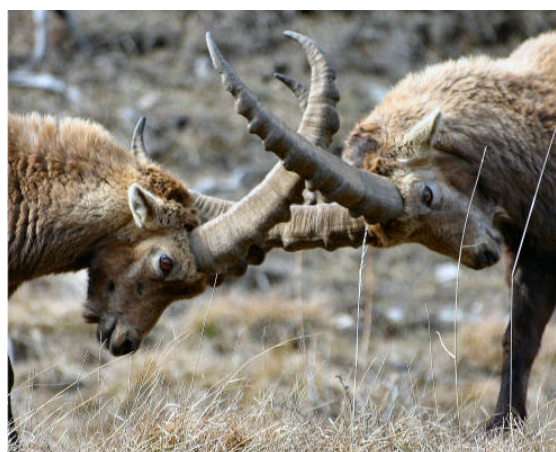
Combat de cornes entre deux jeunes mâles