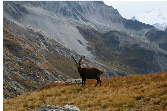
Vieux mâle en Vanoise, à la limite entre alpage et glaciers

paradis, principal refuge de l'espèce. Le Parc national de la Vanoise protège alors intégralement l'animal, qu'il adopte comme emblème. Des animaux commencent alors à sortir du parc, recolonisant naturellement les espaces proches de celui-ci [5] .