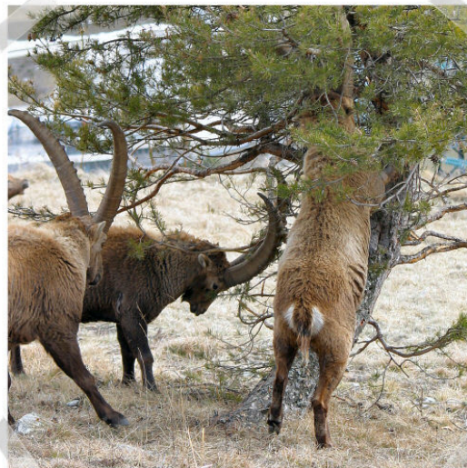
Bouquetin mangeant dans un arbre

Le bouquetin boit très peu, se contentant souvent de la rosée du matin.