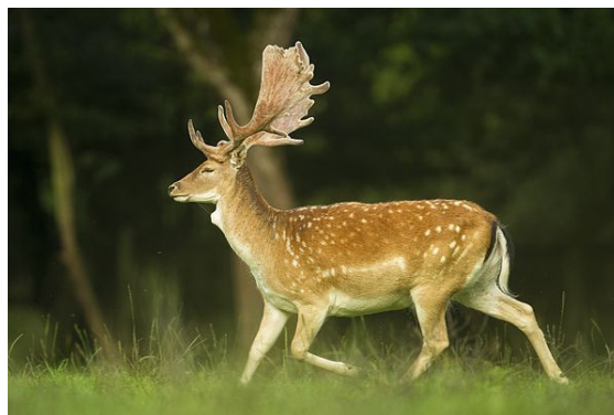
Un daim mâle courant dans la plaine de la réserve animale du Domaine des grottes de Han en Belgique.

Le daim est un animal de taille moyenne. Les mâles mesurent de 135 à 165 cm de longueur, 85 cm à 1 m de hauteur au garrot, 115 à 130 cm au sommet de la tête et leurs poids varient de 45 à 90 kg (60 kg en moyenne) selon les individus. Les femelles, appelées « daines », sont plus petites et plus légères. Elles mesurent de 115 à 145