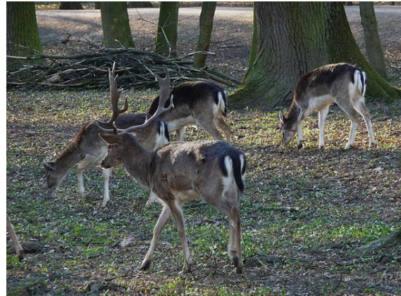
Les daims en hiver, sont reconnaissables à leurs pelages brun/gris, l'intérieur des pattes et le ventre reste toujours blanc.

Le daim peut vivre jusqu'à 25 ans en captivité, mais dans les climats rudes du nord de l'Europe, sa durée de vie moyenne est de 16 ans.