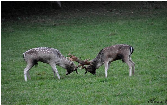
Combat entre deux daims mâles au Domaine des grottes de Han en Belgique pendant la période du rut.

Les mâles sont solitaires ou bien ils vivent en groupes de célibataires et ne rejoignent les femelles qu'au moment du rut qui a lieu en octobre-novembre. Ils se livrent alors à des combats pour posséder le plus de daines. Ensuite, le mâle dominant se choisit un territoire qu'il délimite avec son urine, et en frottant les arbres à l'aide de sa ramure, il pousse des cris rauques, le raire, pour appeler les femelles. La gestation de la daine est de 8 mois. Un faon naît, parfois deux, au mois de juin/juillet. Les bois des mâles atteignent leur plus grand développement en septembre et tombent en mai.