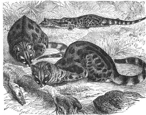
dessin de genetta genetta

Hérodote l'aurait évoquée il y a plus de 2 000 ans, mais on soupçonnait depuis longtemps que les populations européennes actuelles aient comme origine des genettes introduites et naturalisées par les Romains ou les Maures pour défendre les récoltes contre les rongeurs. De plus, son aire de répartition très limitée laissait supposer que sa survie aurait pu avoir été favorisée dans ces régions par l'Homme