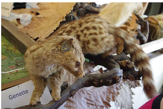
Genette naturalisée dans la Cité découverte nature à Mialet (Dordogne)

Essentiellement cantonnée en Espagne et dans le sud-ouest de la France, ainsi qu'en Italie méridionale. La genette vit et chasse généralement près des points d'eau,