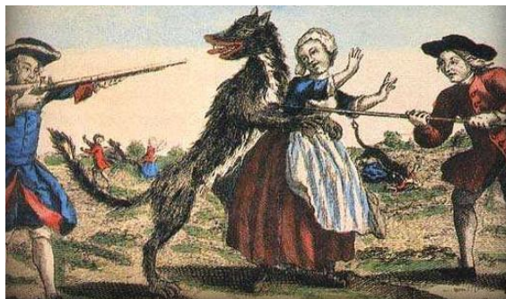
Le loup dans l'imagerie populaire.

Utilisé comme symbole de la nature cruelle et sau-