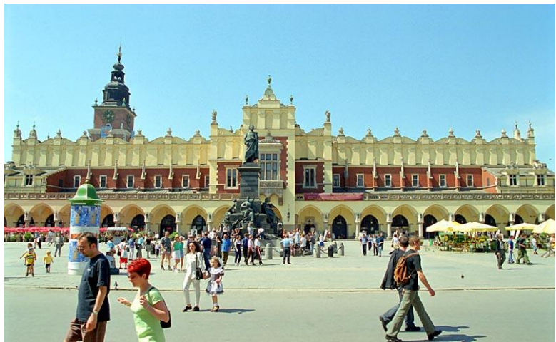
la Halle aux Draps (Sukiennice) à Cracovie (Pologne).