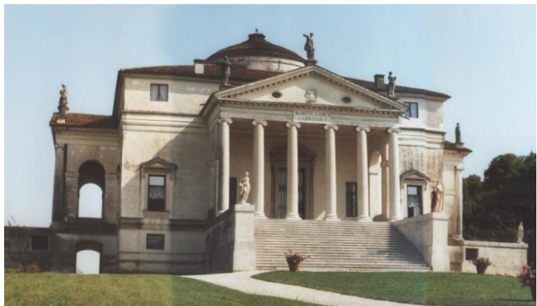
La villa Rotonda à Vicence (Italie), 1567-1570, Villa de Andrea Palladio.

En France, ce mouvement se transporte sous François Ier, cet art découvert lors des batailles entre la France et l'Italie pousse celui-ci à inviter de nombreux architectes italiens à sa cour. Ces architectes bâtiront de nombreux châteaux en adaptant l'architecture de la renaissance italienne aux régions pluvieuses de France (ajout de toiture, ...). Les Châteaux de la Loire en sont un exemple connu, tout comme le Château d'Ecouen, bâti par Anne de Montmorency (1492-1567) à son retour des guerres d'Italie au cours desquelles il découvrit les Palais transalpins.